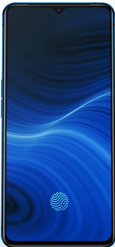
realme X2 Pro