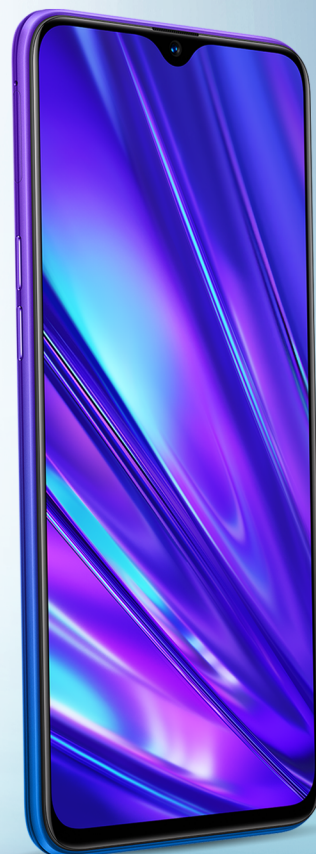
realme 5 Pro